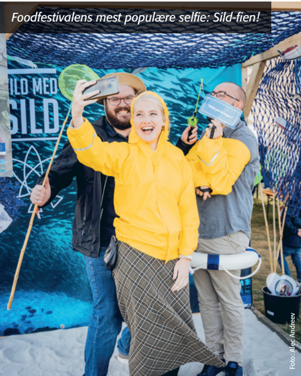
Foodfestivalens mest populære selfie: Sild-fien!