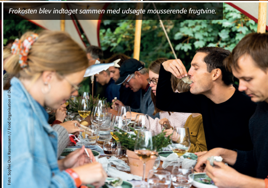
Frokosten blev indtaget sammen med udsøgte mousserende frugtvine.