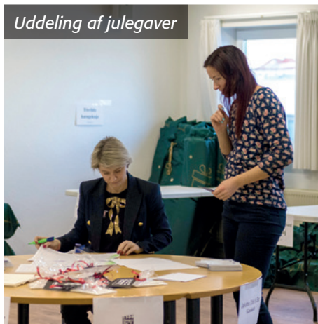
Uddeling af julegaver